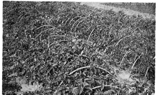
第3図 トンネル栽培